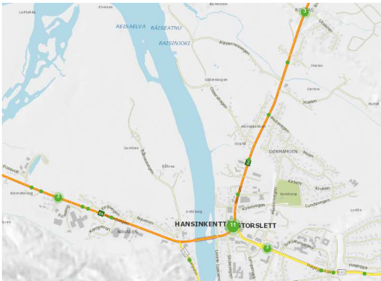
Figur 2 - Storslett-området