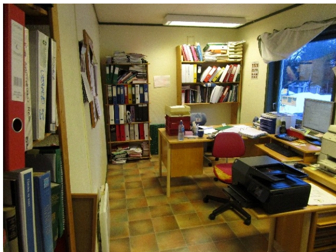
Deler av kontoret på loftet.