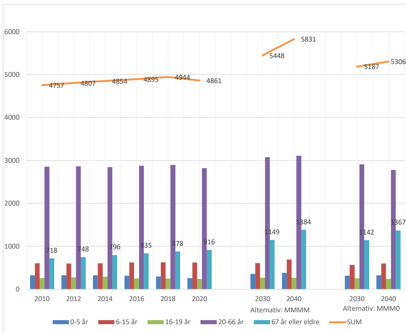
Figur 1 Befolkningsutvikling 2010-2020 og framskrivning til 2030 og 2040 med 2 ulike alternativer (MMMM = ingen nettoinnvandring).

Som man ser av figur 1 under, vil utviklingen av antallet eldre over 67 år være nokså uavhengig av framskrivningsmodell av befolkningstallet. Derimot vil prosentandelen eldre øke ganske kraftig, jf. figur 2 under.