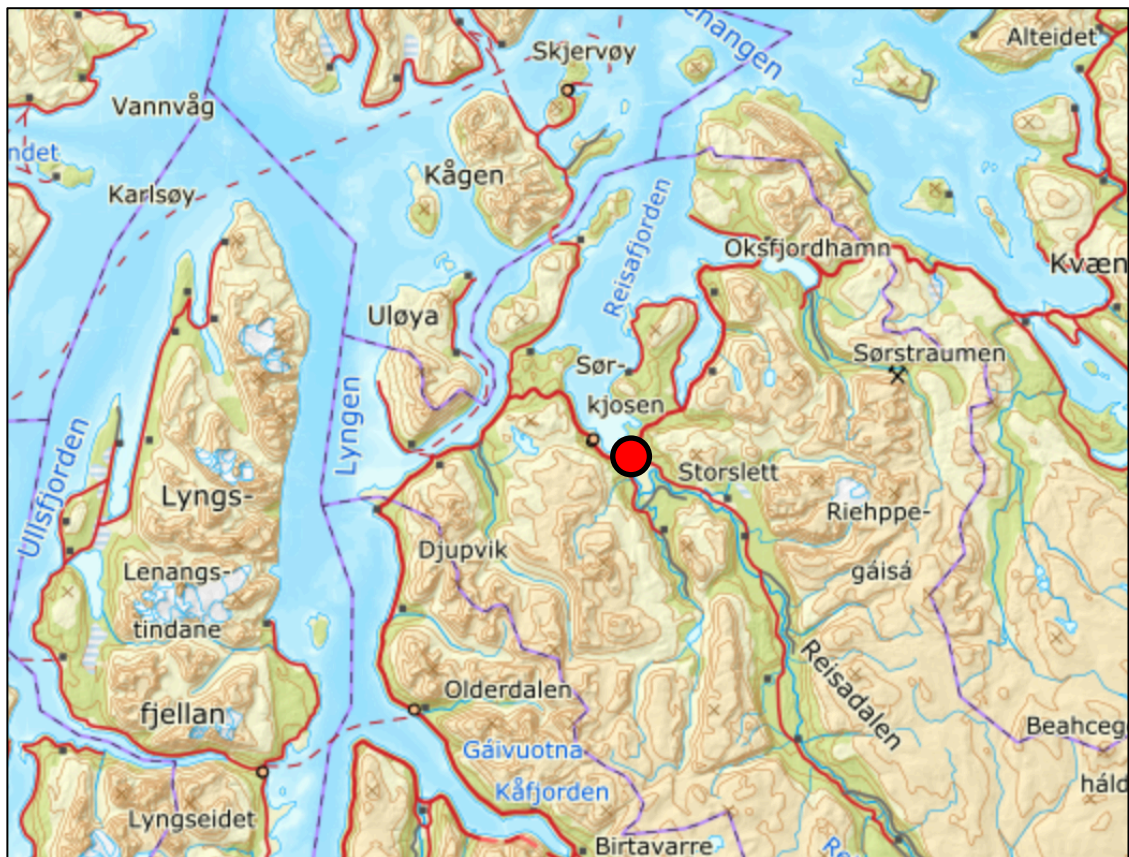
Figur 2.1. Regional plassering av planområdet vises med rød prikk.

Storslett sentrum ligger ved utløpet av Reisaelva til Reisa fjorden i Nordreisa kommune i Troms. Storslett er administrativt sentrum i Nordreisa, og er et tettsted med bebyggelse, næringsliv, skoler og annen infrastruktur. Storslett huser også Halti, nasjonalparksenteret for Reisa nasjonalpark, som er knyttet til Reisaelva, et nasjonalt laksevasdrag. E6 krysser i dag Reisaelva i Storslett sentrum like ovenfor der elva munner ut i Reisa fjorden via et elvedelta.