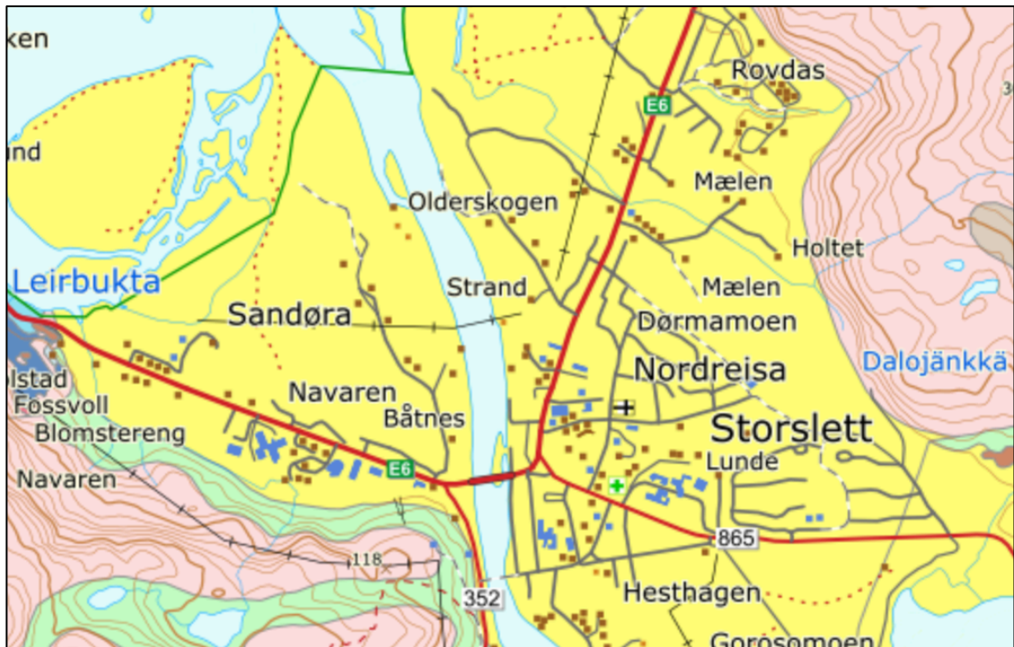
Figur 4.1. Kart som viser forekomst av løsmasser i Storslettområdet. Gul farge viser sedimenter av fluvial opprinnelse (elvedeltater). Grønn farge er morenemateriale.