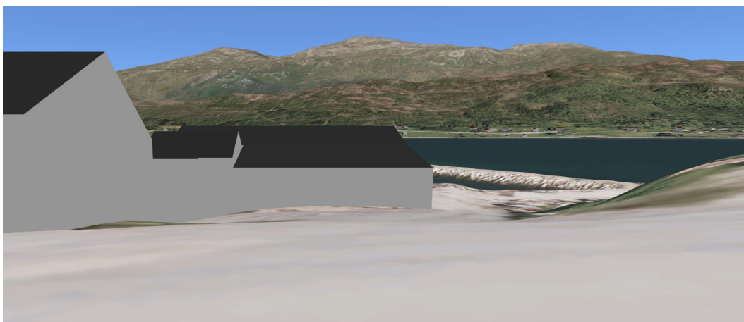
Figur 3-2 Fjelltoppene Svartbergan (539 m), Vardfjellet (604 m). Flere av toppene er mellom 350 og 500 meter.