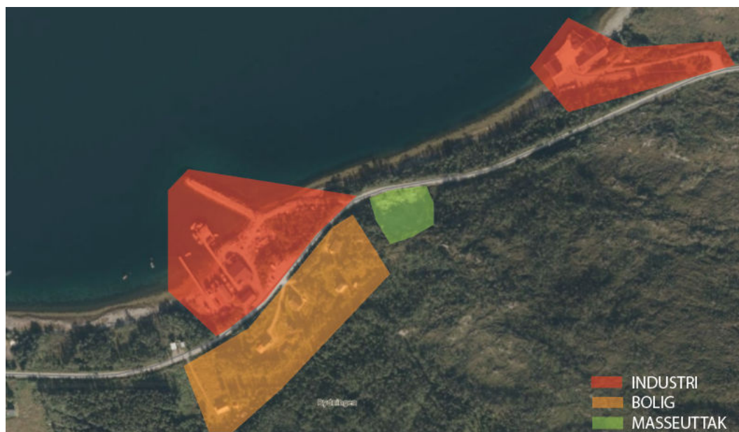
Figur 3-5 registrering av landskapet rundt verftet.

Kystlinje på sørsiden av fjorden har elementer av etablert industri og terrenginngrep. I tillegg til Olsens verft er det et mindre masseuttak og en industrikai med flere bygninger som brukes av oppdrettsnæringen i området. Landskapet på sørsiden av fjorden preges av industrivirksomhet som har vokst opp gjennom store deler av 1900-tallet frem til i dag.