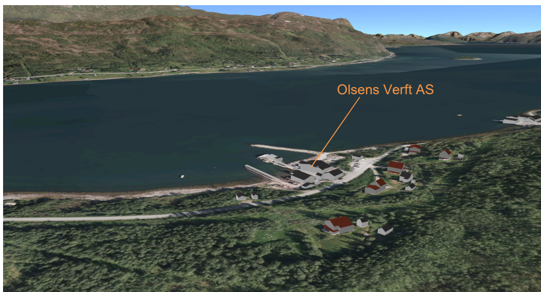
Figur 2-1 Olsens verfts plassering ved Bakkebyfjorden i Nordreisa kommune.