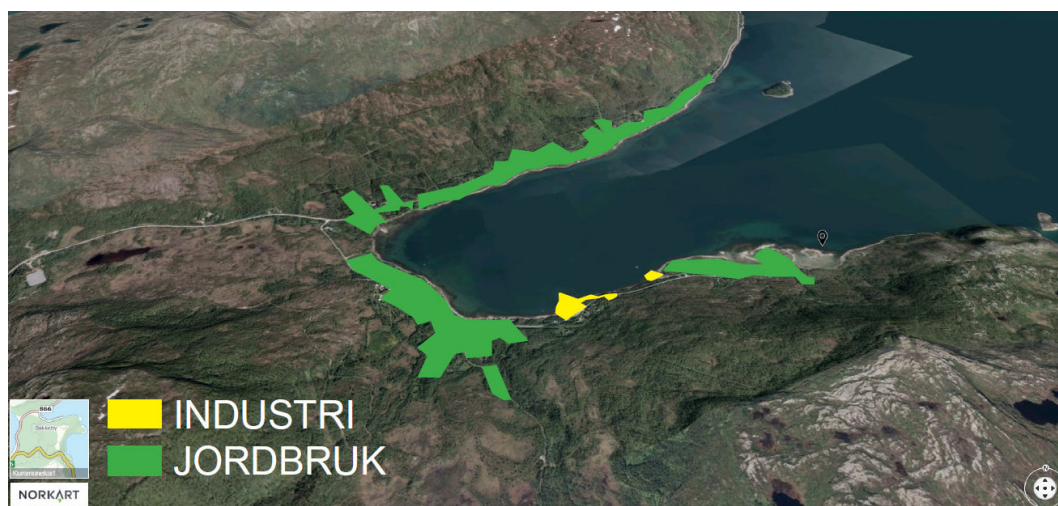
Figur 3-3 Verftet, masseuttak og kai med bygninger skiller seg ut fra gårdsbrukene rundt fjorden. Konsentrasjon av industri danner en industriklynge.

Kystlinjen langs fjorden og det flate terrenget i fjordbunnen er tatt i bruk som jordbruksområde. Områdene varierer i størrelse og er hovedsakelig konsentrert tett rundt gårdsbebyggelse.