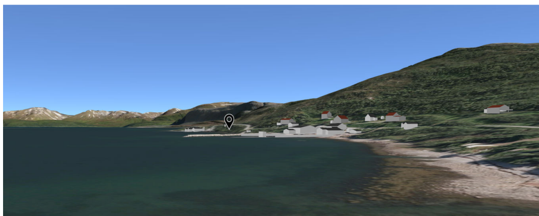
Figur 3-4 Sørsiden av fjorden. Olsens Verft og anlegg til oppdrettsnæringen i bakgrunnen. Boligbebyggelse lengre opp i terrenget.