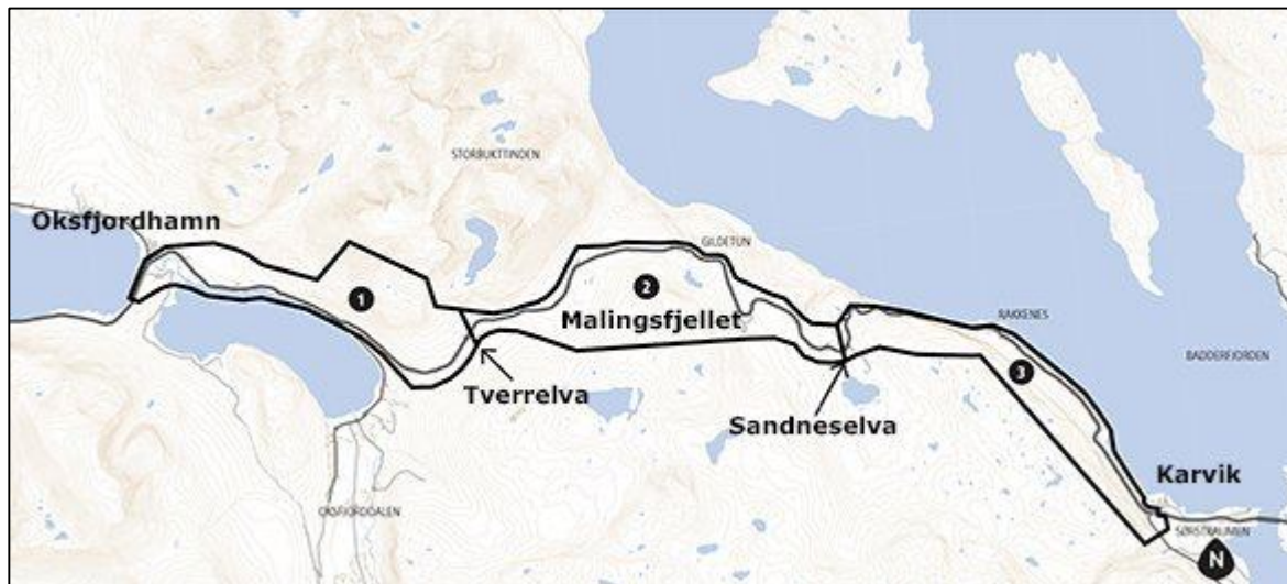
Figur 1: Viser heleplanområdet og de tre delstrekningene.